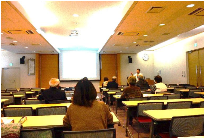
*漢方は飲み方を守ることが大事です

11月17日(土)の定例会は、世界糖尿病デーに伴い例年同様、熊本中央病院にて熊本中央病院糖尿病友の会「わかくさ会」との合同勉強会に12名で参加してまいりました。