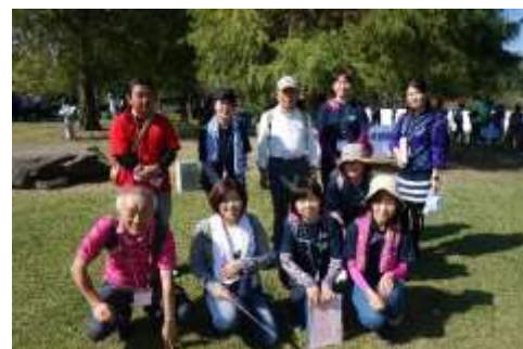
みなさん、暑い中大変お疲れ様でした。