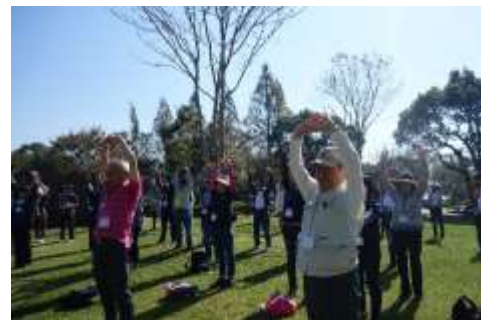
参加者全員での準備運動もバッチリです。