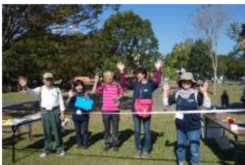
みんなで仲良くゴール!