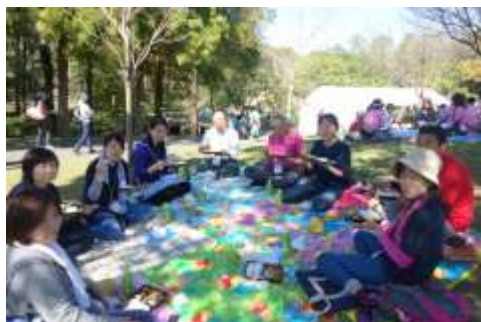
体を動かして外で食べるお弁当は格別だったのではないのでしょうか。