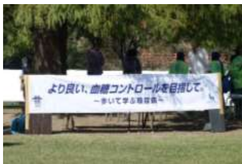
歩いて学ぶ糖尿病ウォークラリー熊本

10月18日(日)熊本市動植物園において「第19回歩いて学ぶ糖尿病ウォークラリー熊本」(日本糖尿病協会・熊本県糖尿病協会主催)が開催され、当院からも患者様と職員10名で参加しました。