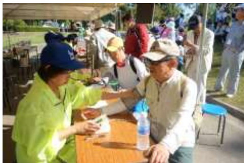
歩く前に、血圧測定です。