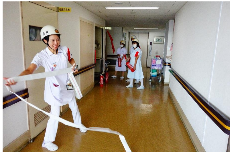
2. 初期消火失敗→消火栓による消火開始です