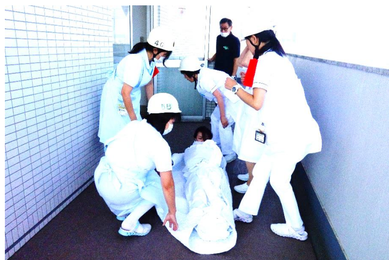
4. 患者役をシート搬送しています