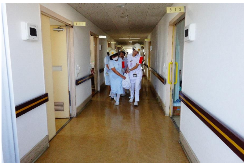
3. 患者さまの搬送開始です