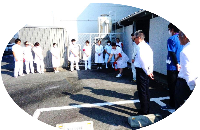
新入職員による消火体験

今回は、防災ヘルメットの着用や救急搬送まで例年になく趣向をこらした訓練ができました。次回からも更に緊張感をもった訓練を実施していきたいと思ひます。