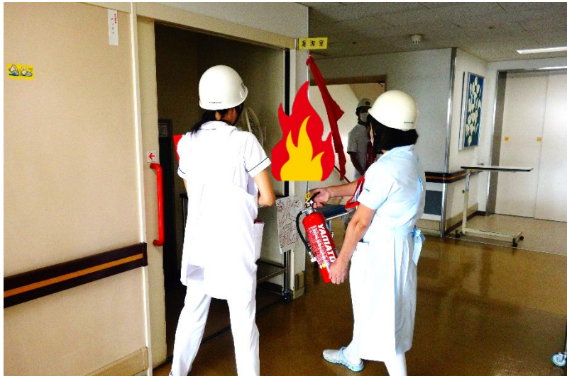
1. まずは、消火器による初期消火です

当院では、年2回の消防訓練を実施しております。 今回は、10月24日（水）に5階病棟にて夜間の出火を想定して消火設備の 担当業者立ち合いの下、初期消火と搬出までの訓練を行いました。